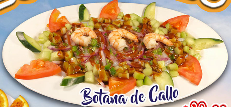
Botana de Callo