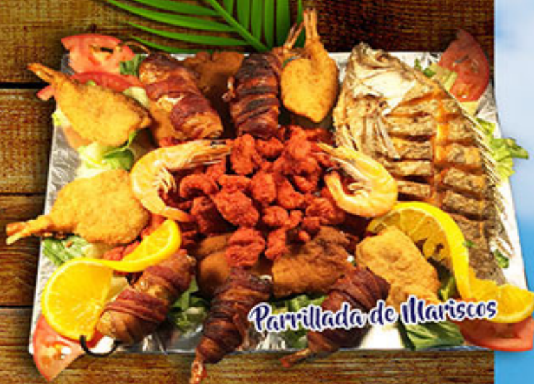
Parrillada de Mariscos